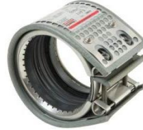
GRIP-L FIRE FENCE